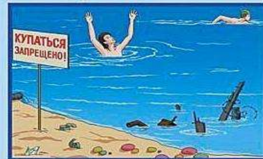
ЭТО ОПАСНО ДЛЯ ЖИЗНИ

Дети и взрослые! Не нарушайте правила поведения на воде. Не купайтесь в запрещённых местах!