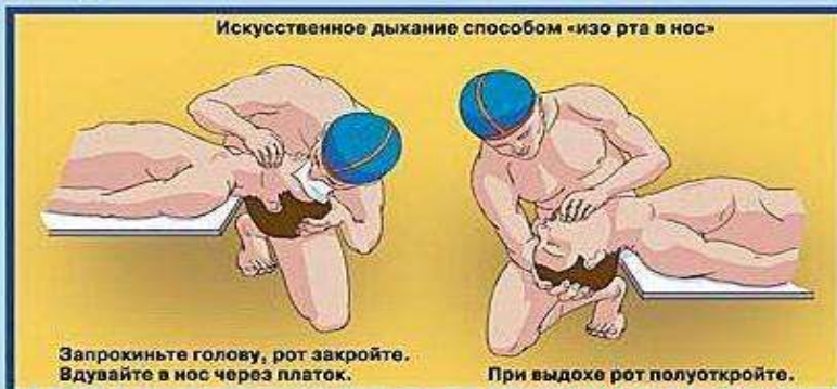
Искусственное дыхание способом «изо рта в нос»