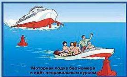
Моторная лодка без номера и идёт неправильным курсом