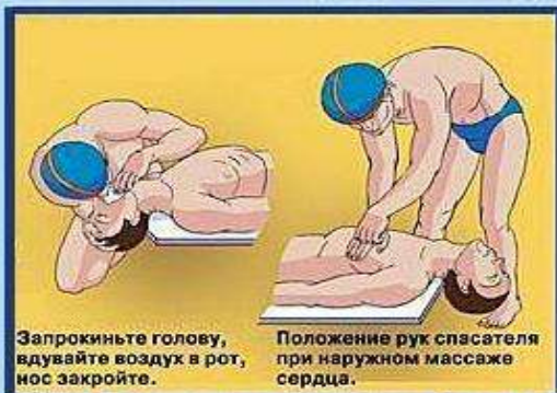
Запрокиньте голову, вдувайте воздух в рот, нос закройте.