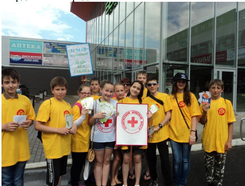
Рисунок 5. Отряд волонтеров Светлогорского Красного Креста

волонтеров и прочитано более 25 лекций. И всё это для того, чтобы приучать молодёжь к милосердию и состраданию.