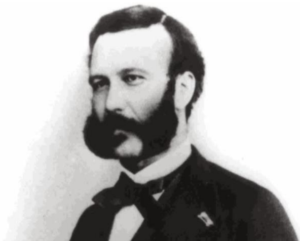
Рисунок 1. Анри Дюнан – основатель Международного движения Красного Креста

Создал Международный комитет Красного Креста - Анри Дюнан, который увидел своими глазами, как более двухсот тысяч местных жителей, были ранены, вот тогда-то ему и пришла идея, чтобы создать, добровольную благотворительную организацию, которая будет помогать раненым во время войн или во время каких-либо вооруженных конфликтов. Он написал книгу, которая вскоре обрела огромный успех на территории Европы. В этой книге он написал свои впечатления о войне, о создании добровольного общества помощи раненым, и необходимость принятия международного соглашения, которое гарантировало бы добровольцам признание и уважение.