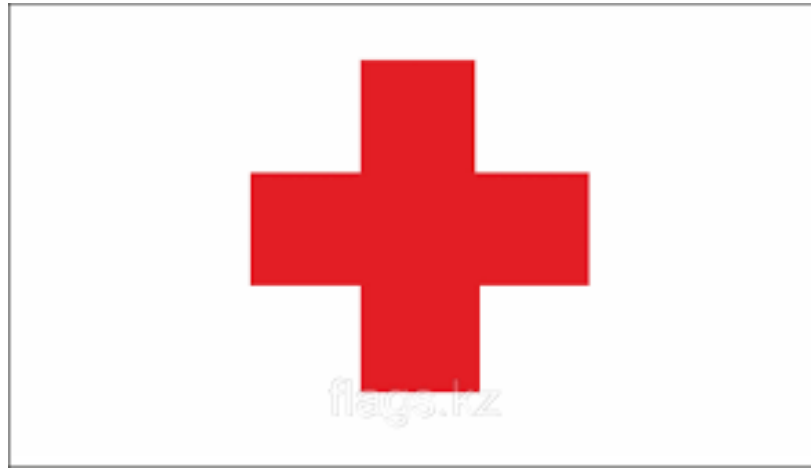
Рисунок 2. Эмблема Красного Креста

Вскоре на Женевской конвенции признали наряду с Красным крестом новую эмблему – красный полумесяц, так как Османская империя отказалась использовать эмблему красного креста, ибо это вызвало негативные ассоциации с участниками крестового похода (крестоносцами).