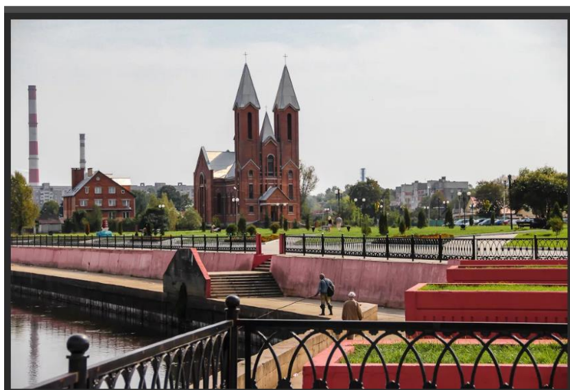
Рис. 7 Крестовоздвиженский костел