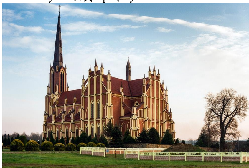
Рисунок 4. Костел Святой Троицы в Гервях