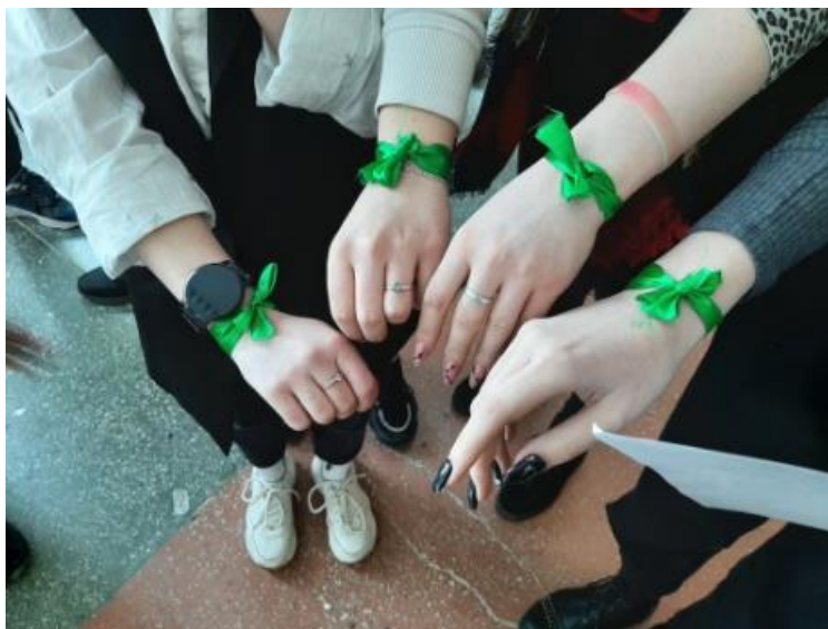
Рисунок 1. Деление участников на команды по цвету ленточки Звучит песня Badya_Svist_- _MAMA-BELARUS_(iPleer.com)

Ведущий 1. Сейчас мы просим экспертов пройти по своим этапам. Остальные участники квеста выберут ленточку определенного цвета. Она будет обозначать принадлежность к той или иной команде. После этого мы просим вас сгруппироваться в соответствии с цветом.