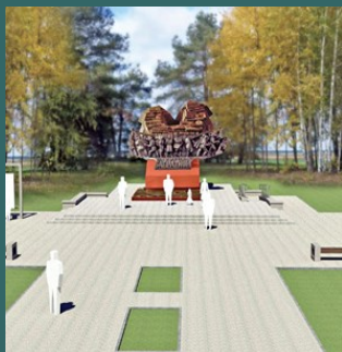
Макет мемориального комплекса, посвященного операции «Багратион»