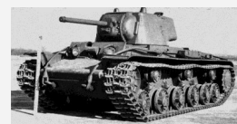
Из книги американского историка М. Кейдина «Тигры горят»

жа. Под прикрытием этого маневра удалось установить и замаскировать еще одно 88-мм зенитное орудие позади советского танка так что на этот раз он сумело открыть огонь. Из 12 снарядов три пробili броню и уничтожили танк. И это был всего один русский танк.